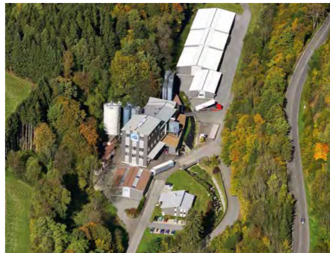
Die Richard Anton KG produziert hochwertige Kohlenstoffe im idyllischen Oberzell