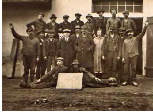
Die erste Belegschaft 1927 im Werk Oberzell

»Nur aus hochwertigen Rohstoffen entstehen perfekte Endprodukte. Das ist der Leitsatz, dem wir Tag für Tag im Interesse unserer Kunden gerecht werden.«