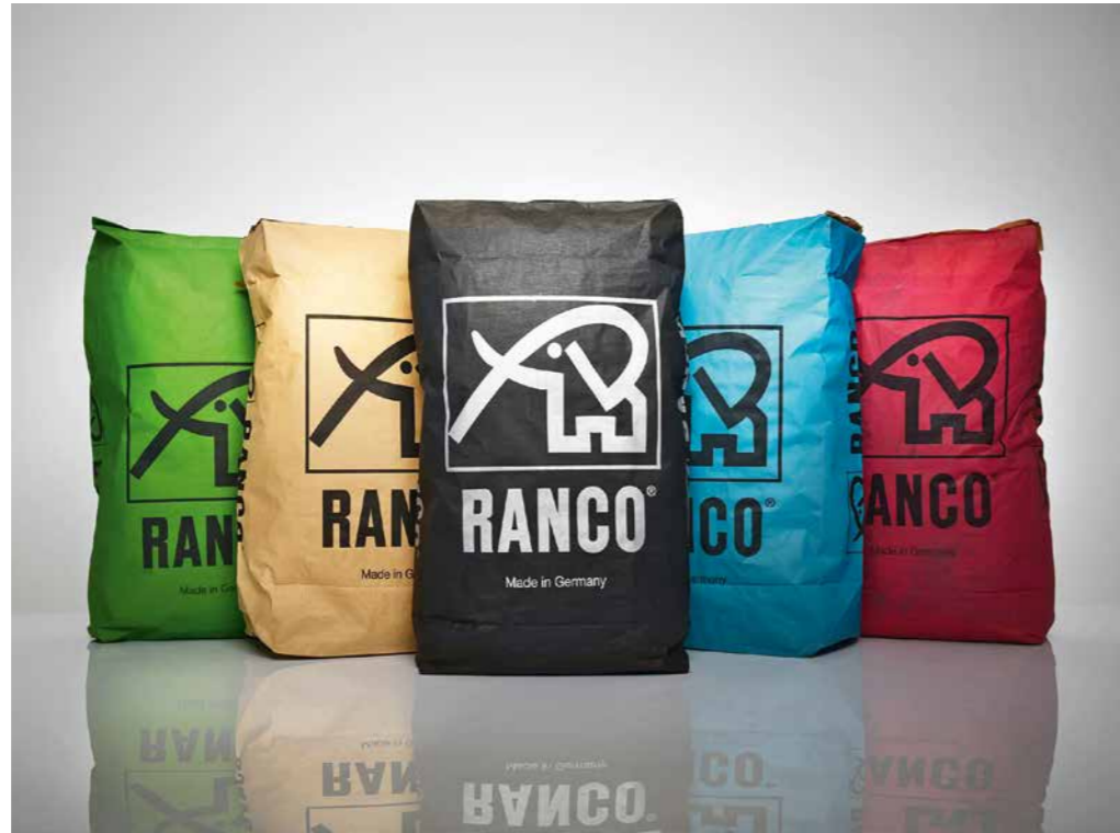
Qualität hat einen Namen – RANCO, die Produktfamilie der Richard Anton KG