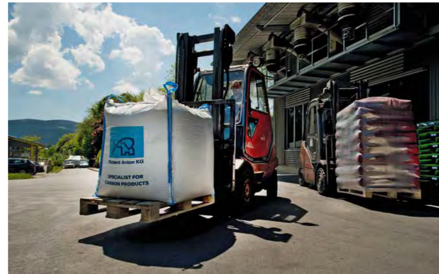
Für ihre vielseitig einsetzbaren Produkte übernimmt die Richard Anton KG auch die Logistik

folge weiter aus. So importierte die Richard Anton KG erstmals im Jahr 1972 Roheisen aus Ungarn, später auch aus Brasilien, Tschechien und Russland. Heute liefert sie alle gängigen Roheisensorten an die Gießereiindustrie. Die Kohlenstoffe werden je nach Einsatz passgenau geliefert, das heißt zerkleinert, gesiebt oder vermahlen. Zuvor werden diese in den werkseigenen Laboren auf ihre Verwendung hin exakt analysiert. Außerdem übernimmt die Richard Anton KG auf Wunsch auch die komplette Logistik.