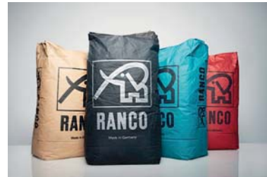
Unter dem Produktnamen Ranco mit dem Markenzeichen als Elefant führt Richard Anton ein umfassendes Sortiment an synthetischen Grafiten, Spezialkoksen und Aufkohlungsmaterialien.